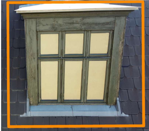
Kvist og vindue trænger til maling

Vi får tilbud på arbejde på taget, som omfatter