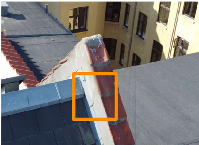
Her ses skade på brandkam

Brandkamme skal repareres. Der er faldet skiferplader ned - én er helt væk, en anden er knækket - og endelig skal der udføres malerarbejde på kvistene, som er medtagne.